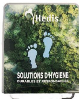
Exemple de personnalisation